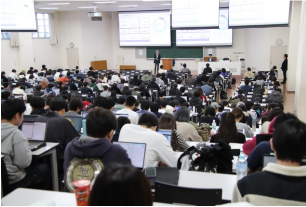
トップマネジメント特別講義