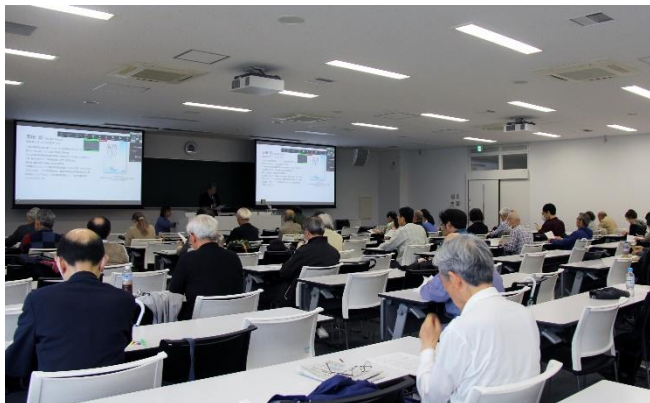
※写真は第3回開催時のもの