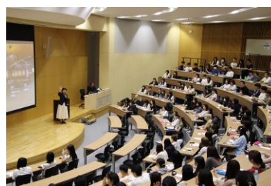
ホスピタリティマネジメント特別講義