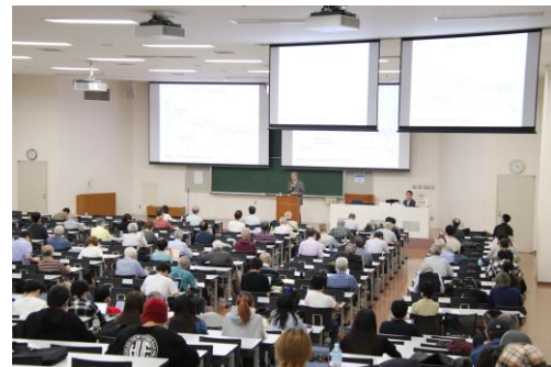
武蔵野市寄附講座「現代教養特講」