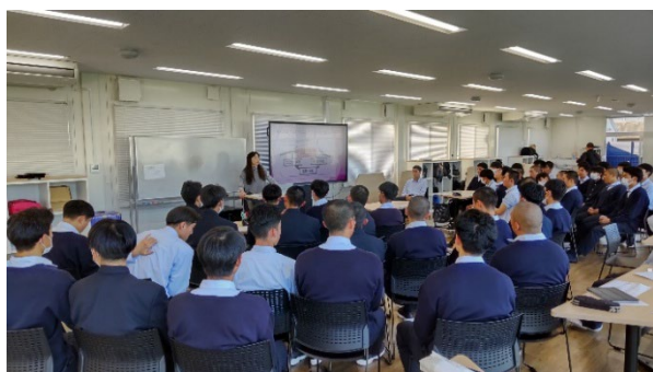
<岩倉高等学校 講義の様子>