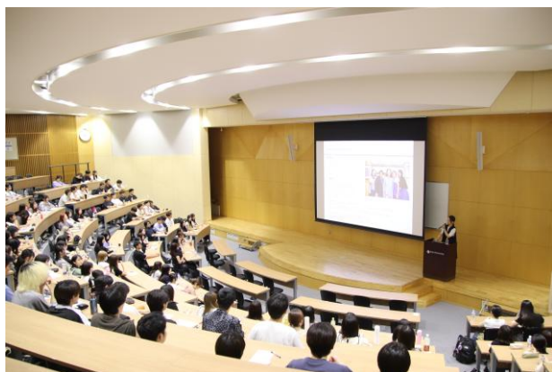
ホスピタリティマネジメント特別講義