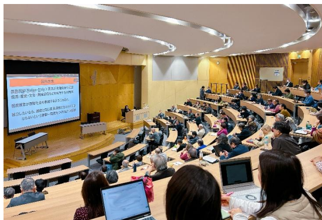
※写真は第2回対面開催時のもの