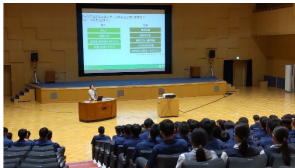
<堀越高等学校 講義の様子>