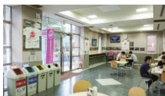
▲8号館 国際交流ラウンジ International Lounge