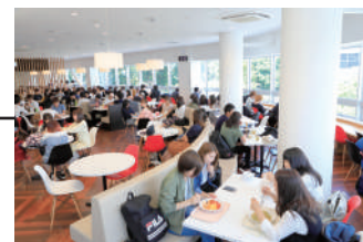
▲ASIA PLAZA 2F フリースペース Free Space in ASIA PLAZA 2F

The student cafeteria is located on the first and second floor. Its warm and relaxing design allows students to comfortably enjoy their meals. The third floor space is suited for various learning styles, such as group study or active learning. It is also referred to as “PLAZA COMMONS,” where students can relax and casually engage in their studies as well as extracurricular activities while having drinks and snacks.