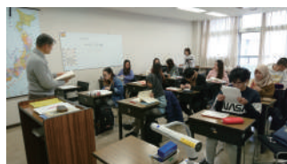
▲8号館 留学生別科の教室 Class: Intensive Japanese Course