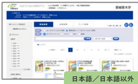
日本語/日本語以外

TOEIC問題集、ビジネスOfficeスキル習得本、ITパスポート試験対策本、地球の歩き方、岩波文庫・岩波新書、各種文化事典 (丸善出版) など