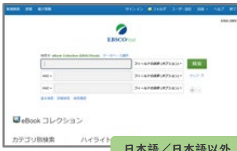
日本語/日本語以外