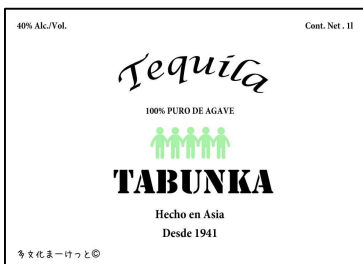
TABUNKAテキーラのラベル