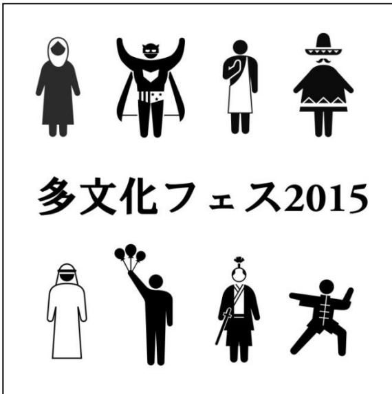
多文化フェス2015イメージ図

6 地域十アメリカの伝統的・代表的な祝祭（フェスティバル）を再現します。5号館の180名収容の教室（予定）で、7 地域の祝祭用の供え物などを作り、その前で民族衣装を着て、来場者にそれぞれの祝祭について説明します（下図参照）。特定の時間に、簡単なパレードをする予定です。