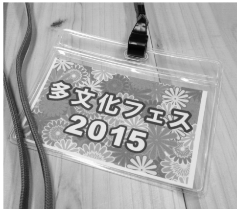
ほんとうはカラフルなんです。

10月22日の専門ゼミで各地域の担当者から展示の内容が発表されました。祭りは現在の暦(グレゴリオ暦)にそって並べます。ただし、各地域の祭りは現在の暦ではなく、それぞれの暦に従って行われています。例えば、中国と韓国は太陰暦に従っており、バリのガランガン・クニンガンは一年を210日とするバリ暦に従っています。伝統的な暦と現在の暦が混在する多文化的な様子を展示します。準備と片付け、当日のお手伝いなど、ちよつと人が足りません。当日の飛び込み参加でもOKです。ぜひお手伝いください。当日、飛び込みでお手伝いしている方は左の名札を下げている実行委員に声をかけてください。