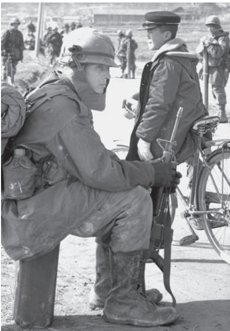
このころの中学生が漢江の奇跡の主役になった