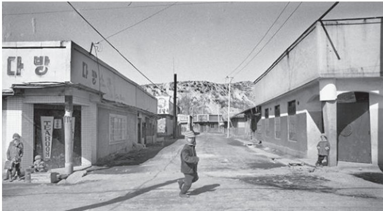
基地の街の昼下がり 子ども以外誰もいない