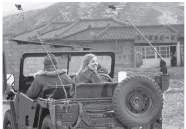
笑顔の看護兵 どこでも米軍ジープが走り回っていた