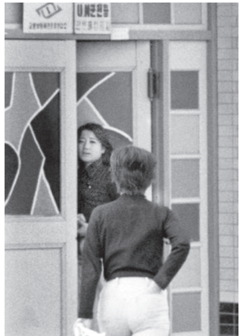
米軍専用バーに出勤する「洋公主」