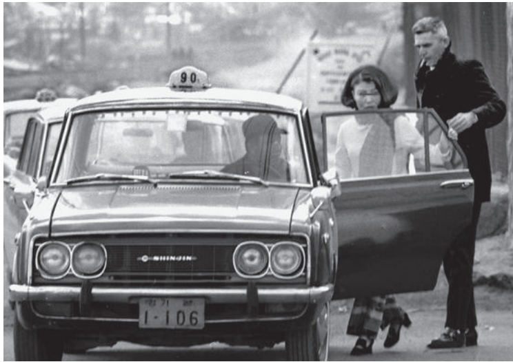
米兵と共にタクシーに乗り込む「洋公主」