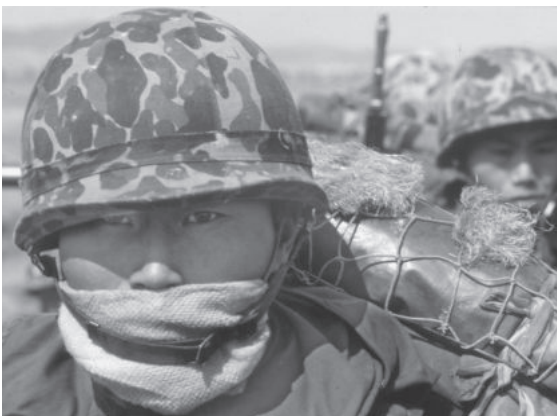
韓国軍の精鋭部隊