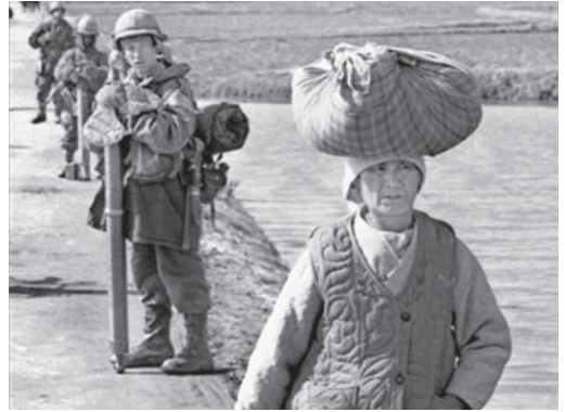
戦場だった村が演習地になった